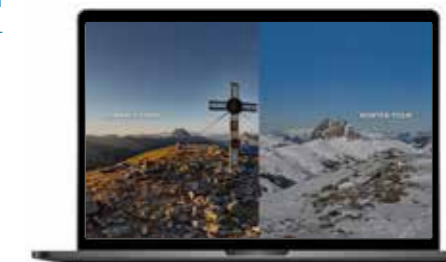
Perspektivenwechsel Sommer/Winter mit einem Klick