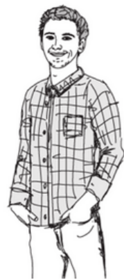
Tobias Vetter. Geschäftsführer faszinatour

Aufgrund der fortschreitenden Entwicklung des Klimawandels ist zu erwarten, dass die Schneedecke in den Alpen zukünftig weiter schwinden wird. Neben den ökologischen Konsequenzen stehen insbesondere kleine Skigebiete in mittleren Höhenlagen und ihre Gemeinden vor der Herausforderung, auch die sozioökonomischen Auswirkungen dieses Rückgangs zu bewältigen. Der Begriff „Schneesicherheit“ gehört in den meisten Skigebieten der Vergangenheit an. Es stellt sich die Frage nach ganzheitlichen Lösungsansätzen, um schneearme Winter im Skigebiet optimal zu nutzen und gleichzeitig Attraktionen für den Sommertourismus am Berg zu schaffen – faszinatour ADVENTURE PARK SOLUTIONS leistet mit seinen Konzepten dazu einen entscheidenden Beitrag.