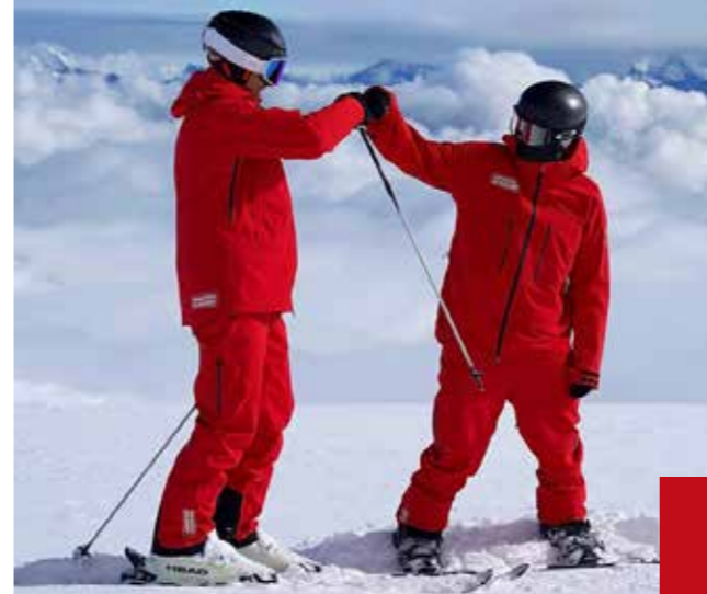
Teamspirit als Erfolgsfaktor