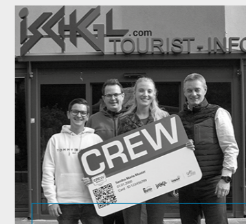
MATHIAS CREW Team Ischgl * angefragt

HOST: „SkilehrerInnen als zentraler Erfolgsfaktor im alpinen Tourismus“